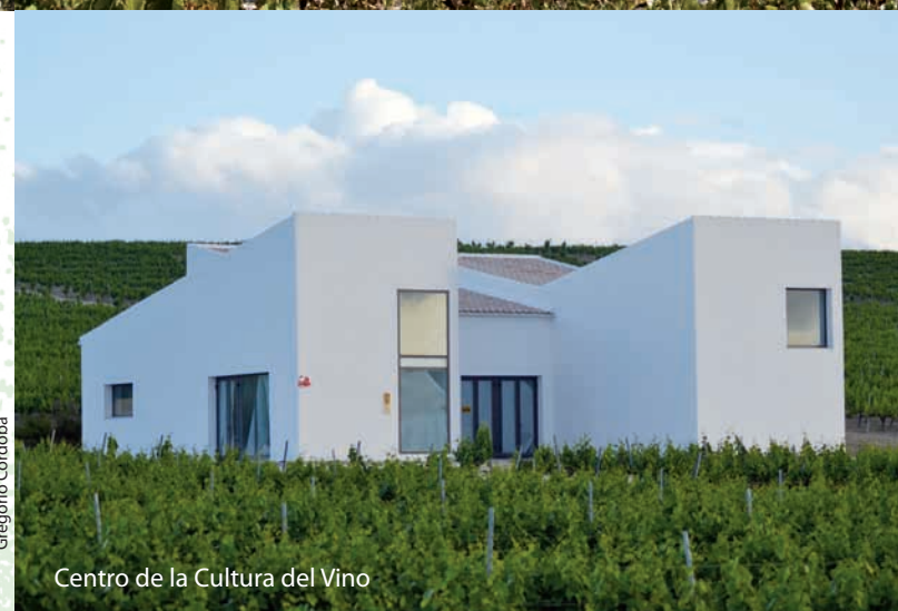
Centro de la Cultura del Vino