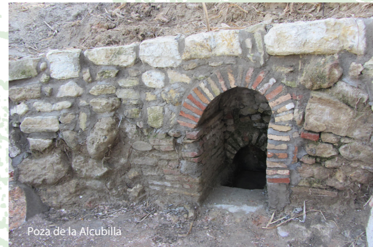
Poza de la Alcubilla