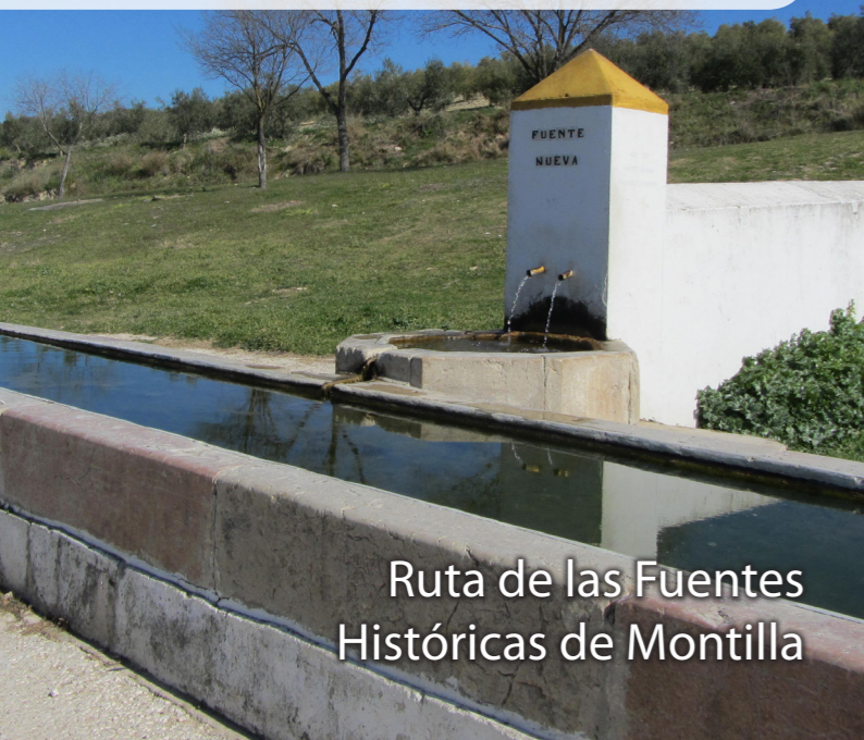
Ruta de las Fuentes Históricas de Montilla