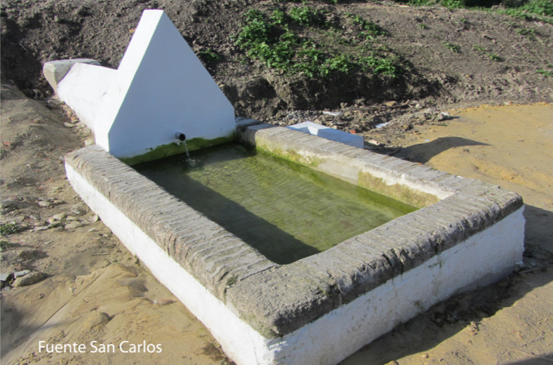
Fuente San Carlos