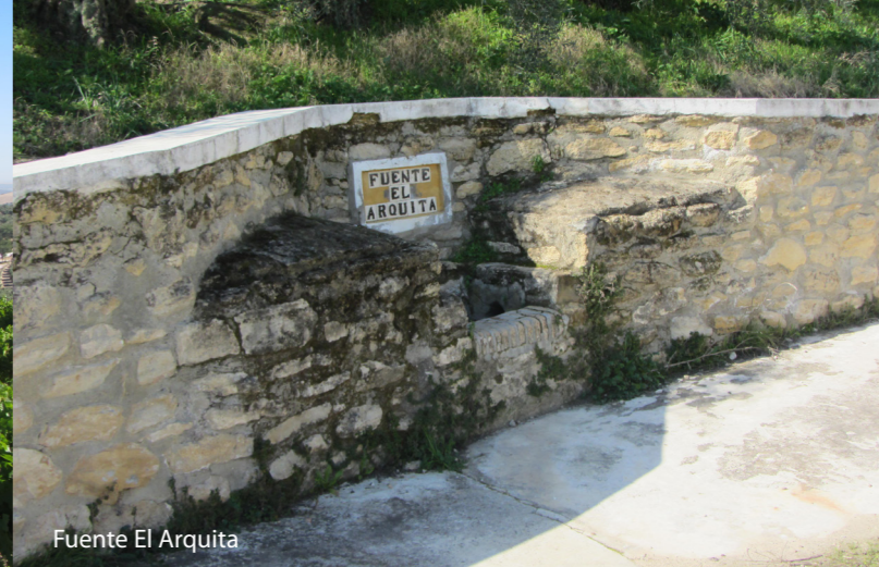
Fuente El Arquita